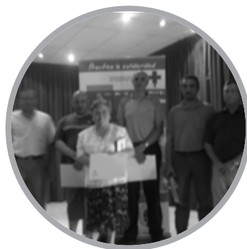
Medalla de Oro y Nacionales