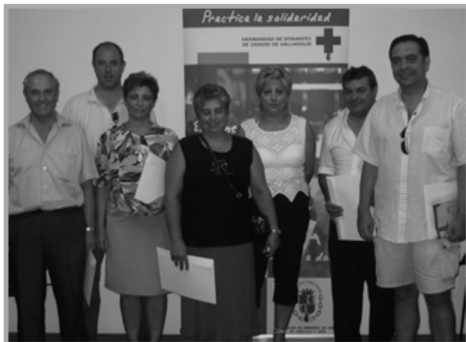
Medalla de Oro, Feria de Muestras