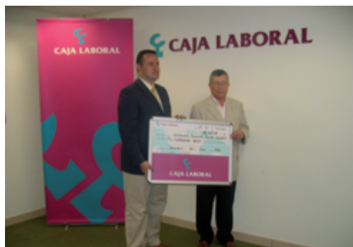
Subvención Caja Laboral