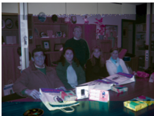
Premio Sorteo Generosidad

Visita nuestra web: www.hdsvalladolid.com